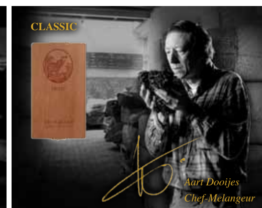
CLASSIC – Von Tradition geprägt