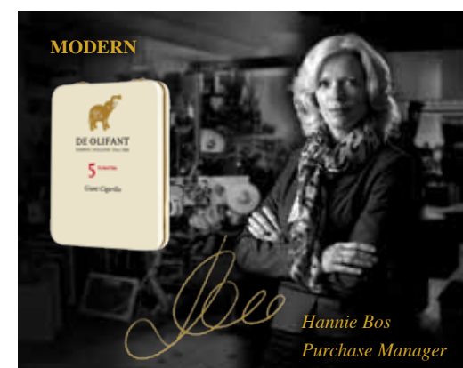
MODERN – Ikone der Gegenwart