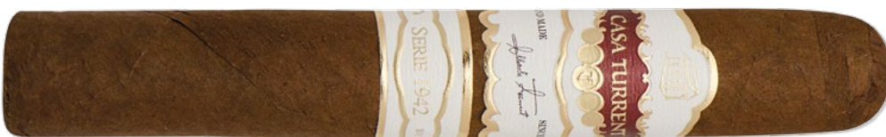
Casa Turrent Serie 1942: Robusto | ◆ 133 mm | Ø 19,8 mm | VE: 20 Stück