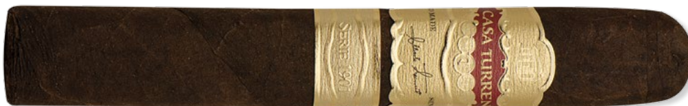
Casa Turrent Serie 1901: Robusto Maduro | ◆ 133 mm | Ø 19,8 mm | VE: 20 Stück