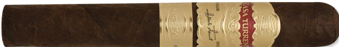
Casa Turrent Serie 1901: Gran Robusto Maduro | ◆ 152 mm | Ø 20,6 mm | VE: 20 Stück

Das jedoch noch viel mehr Potenzial in ihnen schlummert beweisen sie mit der »A. Turrent Triple Play«. Die Marke ist eingeschlagen wie eine Bombe und muss sich nicht verstecken. Und das tut sie auch nicht: Die silberne Bauchbinde bildet einen tollen Kontrast zum dunklen ölig schimmernden Deckblatt. Ein Highlight in jedem Humidor! ■