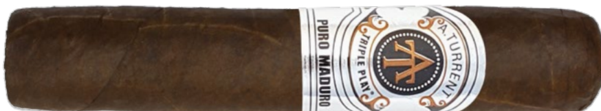
A. Turrent Triple Play: Robusto | ◆ 114 mm | Ø 21,4 mm | VE: 21 Stück