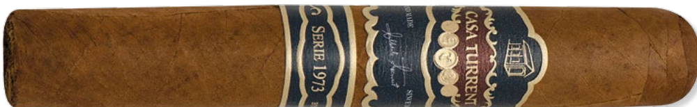
Casa Turrent Serie 1973: Robusto | ◆ 133 mm | Ø 19,8 mm | VE: 20 Stück